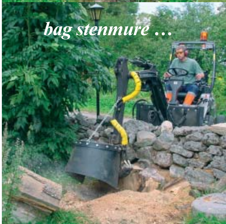
bag stenvure ...