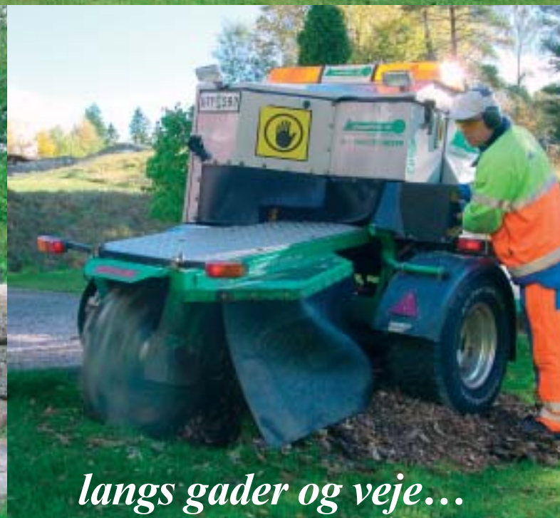
langs gader og veje...