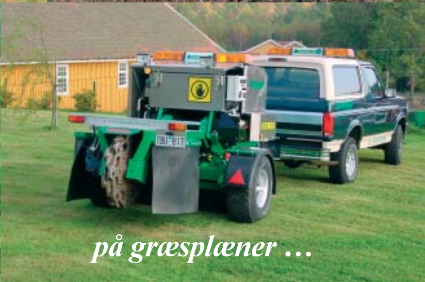
på græsplæner ...