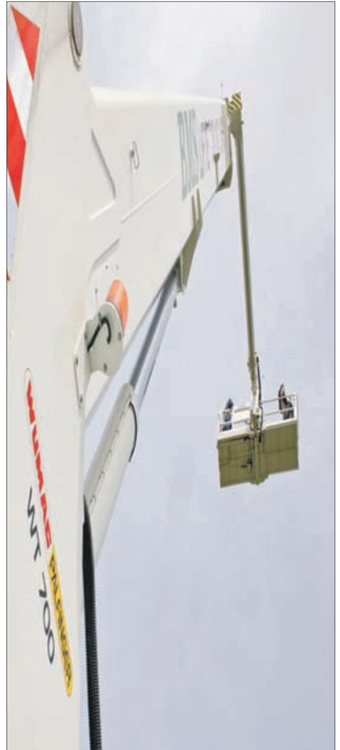
BMS gentager spøgten med at sende udstillingsgæster op i de højere luftlag.

Pleje- og dybdefræsning Ekstensiv fræsning